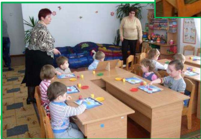
Друзі для рибки