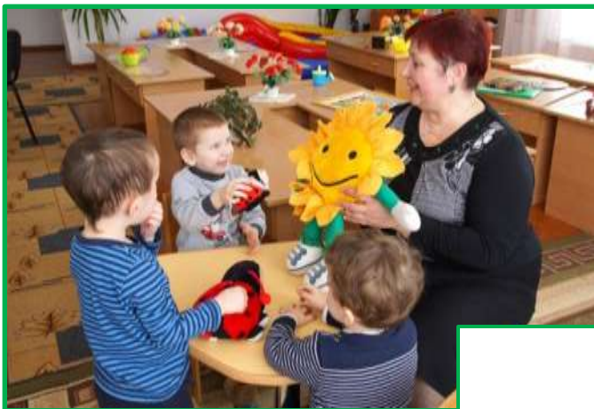
Заняття-гра за твором В. Сухомлинського "Жук-вусач"