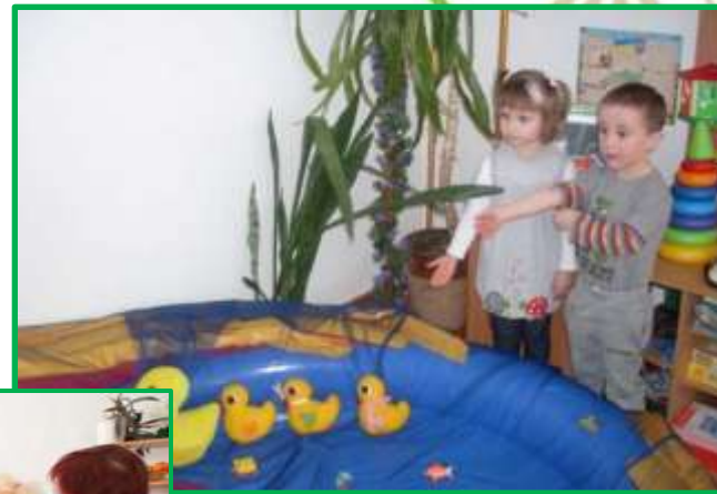
"Хто у воді живе?"